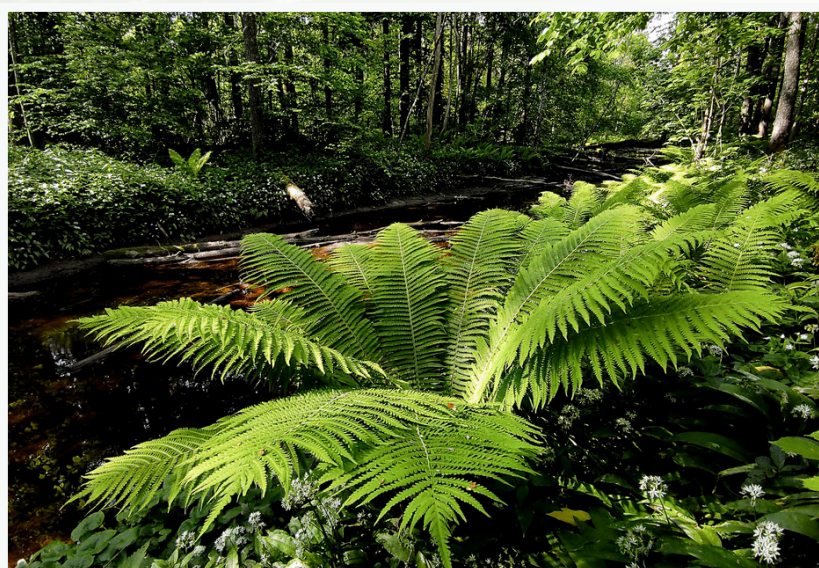
Geros būklės aliuvinių miškų buveinė Būdos-Pravieniškių miškų biosferos poligone.

Natura 2000 tinklą reikia įtraukti ne mažiau nei 20 proc. paprastų ir 60 proc. prioritetinių buveinių. Pradėtoje procedūroje nustatyta, kad Lietuva yra įsteigusi per mažai „Natura 2000“ teritorijų, be to, esamose teritorijose neužtikrinama vertybių apsauga. Pažeidimo procedūra gali lemti tai, kad jei per nustatytą laikotarpį trūkumai nebus pašalinti, Lietuvai teks atsakyti ES Teisingumo Teisme. Per pastaruosius penkerius metus Lietuva stipriai pasistūmėjo steigdama naujas Natura 2000 teritorijas, tačiau problemos vertybių apsaugos srityje vis dar egzistuoja, todėl būtini tolesni veiksmai, kad būtų išvengta galimų sankcijų.