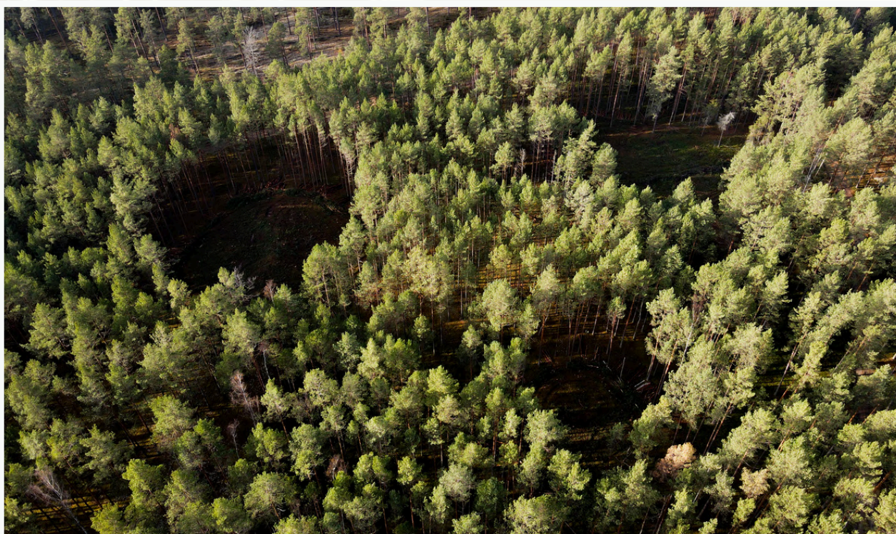
Medyno struktūrinės įvairovės atkūrimas kultūrinės kilmės (sodintuose) Dzūkijos pušynuose, formuojant retmes. V. Vyšniausko nuotr.

nepažeisti esamų vertybių, įvertinti, kiek saulės šviesos po kirtimų pasieks žemę (Tinya et al. 2023). Tam gamtotvarkos planuose paprastai numatomi biologinės įvairovės palaikymo kirtimai. Tai specialiųjų kirtimų rūšis, kurios pagrindinis tikslas – sudaryti geras sąlygas gamtos vertybėms išlikti ar joms atsirasti.