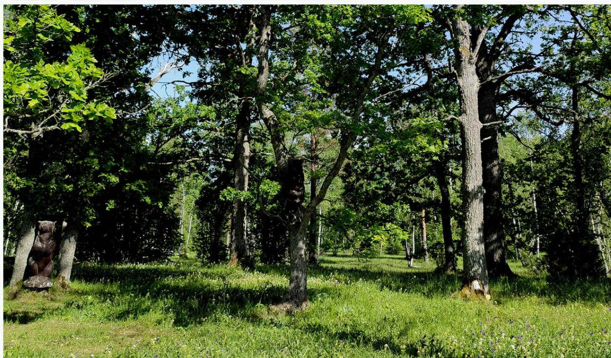
Viršuje – atkurta medžiais apaugusi ganykla Kėdainių rajone. Apačioje – geros būklės medžiais apaugusi ganykla Estijoje.