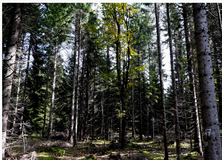
Kairėje – žmonių pasodinti vienaamžiai medynai, stelbiantys vertingas lapuočių medžių rūšis Čekijoje; dešinėje – plantacinio medyno pertvarkymas į labiau natūralų, atveriant erdves lapuočiams bei sudarant sąlygas kartu formavimuisi Čekijoje.