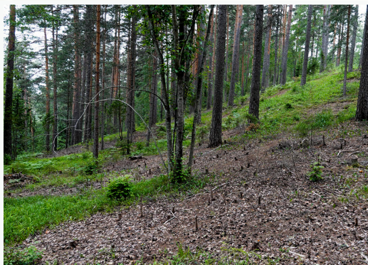
Apšvietimo sąlygų gerinimas šilumamėgiams augalams ir gyvūnams (prieš ir po gamtotvarkos) Suomijoje.